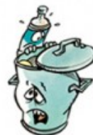
Poids d'une poubelle en 1980: 380 kg/hab/an