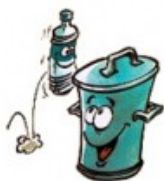
Poids d'une poubelle en 1960: 220 kg/hab/an

Ces objectifs ont été fixés suite à un constat simple : de plus en plus de déchets au niveau national, donc des coûts en constante augmentation.