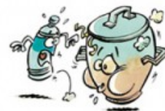
Poids d'une poubelle en 2007: 594 kg/hab/an